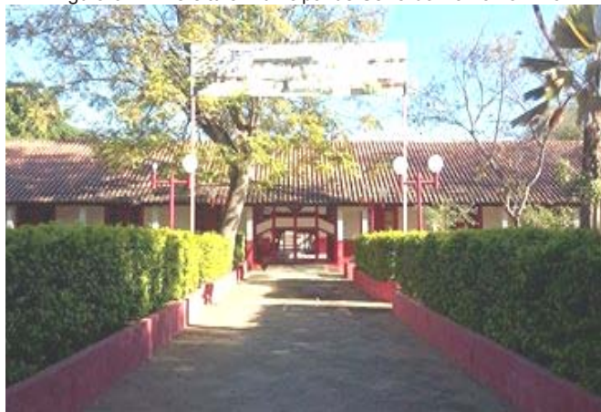
Figura 07 – Prefeitura Municipal de Serra do Ramalho – Ba