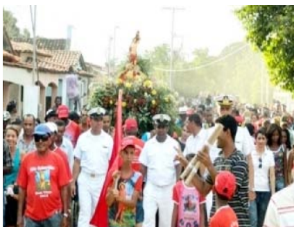
Festa de São Sebastião - Povoado de Boa Vista