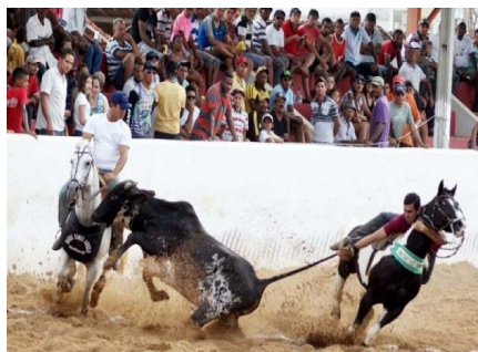
Vaquejada de Serra do Ramalho - Ba