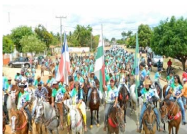
Cavalgada de Serra do Ramalho - Ba