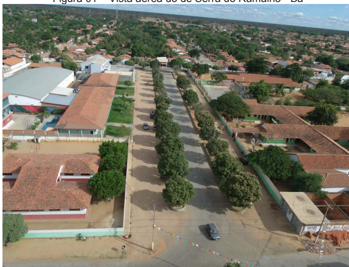
Figura 01 – Vista aérea do de Serra do Ramalho - Ba