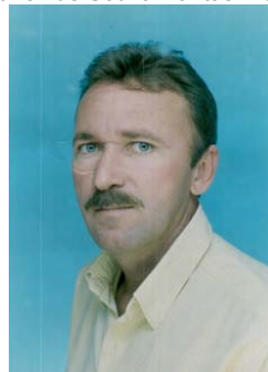
Figura 3 - 2º Prefeito de Serra do Ramalho Dumouriez de Souza Dantas Wanderley