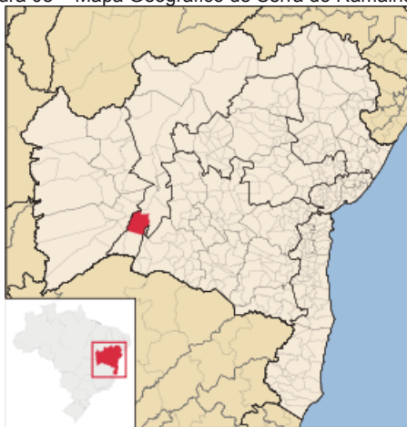
Figura 08 – Mapa Geográfico de Serra do Ramalho-BA