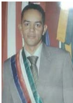
Figura 4 - 5º Prefeito de Serra do Ramalho Deoclides Magalhães Rodrigues