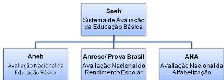
Figura 10 - Avaliações Externas