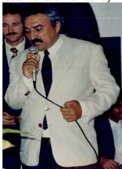
Figura 2 - 1º Prefeito de Serra do Ramalho Boileau Dantas Wanderley Filho